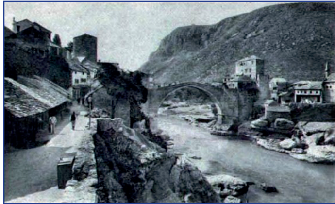
Sırların top atışı ile yıktıkları tarihi Mostar Köprüsü

Temmuz 1989'da Slovenya parlamentosu bağımsızlığını ilan etti. Bunu Hırvatistan izledi. Bu iki gelişme Yugoslavya'nın parçalanma sürecini hızlandırdı. Mart 1991'de Sırp - Hırvat çatışmaları başladı. Haziran 1991'de Yugoslav (Sırp) ordusu Slovenya'ya girdi. 8 Eylül 1991'de ise Makedonya bağımsızlığını ilan etti. 27 Kasım 1991'de Bosna - Hersek'in bağımsızlık ilanı ile, Yugoslavya'yı oluşturan 6 cumhuriyetten Sırbistan ve Karadağ dışındaki 4'ü bağımsız oldu. Aralık 1991'de, Bosna - Hersek'teki Hırvat ve Boşnaklar, bağımsız bir devlet olarak tanınmalarını istedi. Buna karşılık Bosnalı Sırlar da kendi bağımsızlıklarını ilan etti.