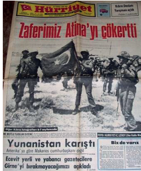
1974 Kıbrıs Barış Harekâtı basında bu şekilde yer buldu.

Kıbrıs Türk toplumu kendi bölgesinde gelecekteki bağımsız Federal Kıbrıs Cumhuriyeti'nin kurulmasına yol açacak düzenin hukuki esaslarını yaratmak amacıyla, 13 Şubat 1975 tarihinde Kıbrıs Türk Federe Devleti 'ni ilan etmiş, federe devlet temelinde ortak bir yapı kurma çabalarının bir sonuç vermemesi üzerine konfederat bir devletin unsu-