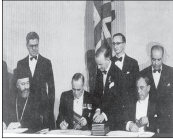
Kıbrıs Cumhuriyeti'nin kuruluş anlaşması imzalanırken (1960)

1960 Garanti Antlaşması, Türkiye, İngiltere ve Yunanistan'a Kıbrıs Cumhuriyeti'nin anayasal düzeninin garantörlüğü sorumluluğunu yüklemiştir.