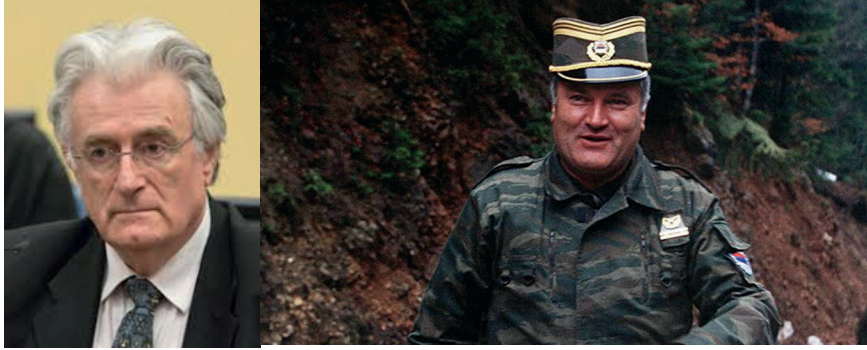
Bosna Sırplarının lideri Radovan Karadžić ve Komutanı Ratko Mladić, Bosna katliamının en önemli aktörleriydi.

Bosnalı Sırp, Bosna - Hersek'te etnik arındırma çalışmalarına başlayarak, buradaki Boşnak ve Hırvatları acımasızca katletmeye başladılar.