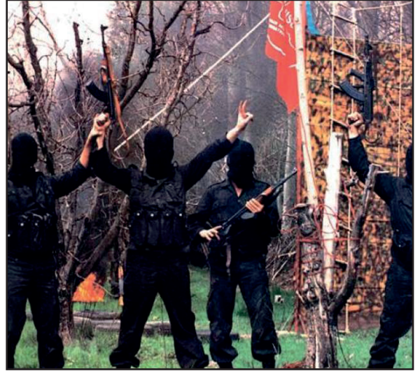
Asala Terör Örgütü

İkinci Dünya Savaşı'ndan sonra Türkiye'nin NATO'ya girmesi, Sovyet Rusya tarafından iyi karşılanmadı. Bu nedenle Sovyet Rusya, Türkiye'ye karşı Ermeni kozunu kullanmayı planladı. Sovyet Rusya'nın bu planı hem Ermenistan'ın hem de Türkiye dışındaki Ermenilerin hoşuna gitti. Ermeniler, seslerini ve isteklerini duyurabilmek ve dünya kamuoyunu etkilemek için 1973'te Los Angeles'ta, Türk konsolosunu öldürerek Türkiye'ye ve Türklere karşı terör hareketini başlattılar. 1975'ten itibaren yurt dışındaki görevlilerimiz, elçiliklerimiz ve kuruluşlarımıza yönelik Ermeni saldırıları yoğunlaştı. Bu saldırıları yönlendiren Ermeni terör örgütü olan ASALA (Ermenistan'ın Kurtuluşu İçin Ermeni Gizli Ordusu) , 20 Ocak 1975'te Beyrut (Lübnan)'ta kuruldu. ASALA, 20 Ocak 1975 günü Beyrut'taki Dünya