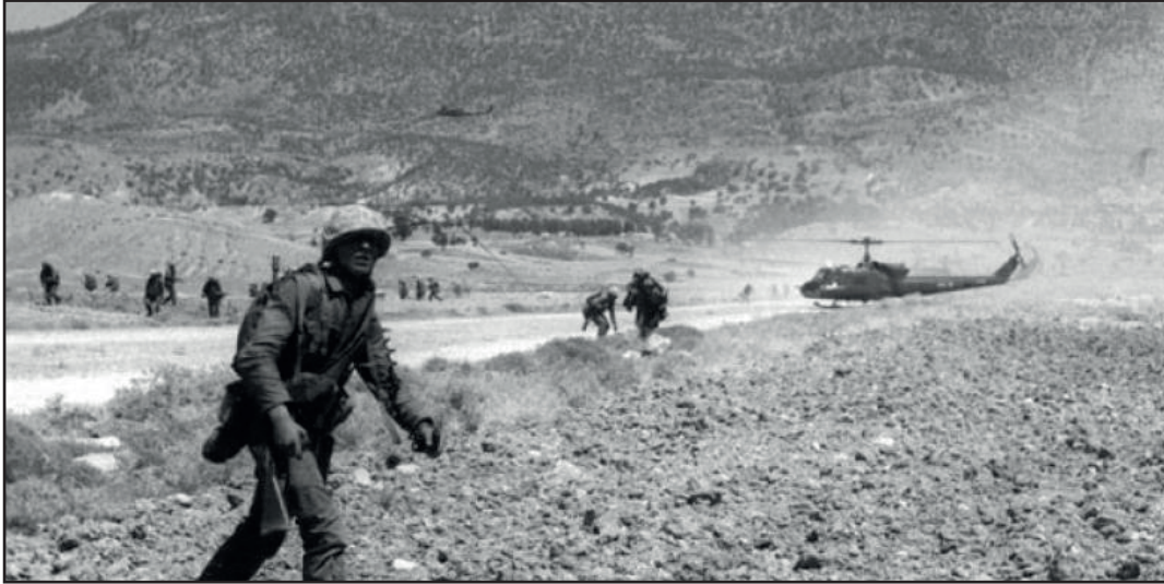
1974 Kıbrıs Barış Harekati

Kıbrıs Türk toplumu ile tarihsel ve kültürel bağları olan Türkiye, adada kalıcı barış ortamını sağlayan ve milli menfaatlerimizi koruyan Birleşmiş Milletler çatısı altındaki toplumlar arası görüşmelere destek vermektedir. Ancak Rum tarafının uzlaşmaz tutumu nedeniyle, Kıbrıs sorununda adil ve sürdürülebilir bir antlaşma sağlanamamıştır. Buna rağmen AB, GKRY'yi tüm Kıbrıs'ı temsilen 01 Mayıs 2004 tarihinde tam üyeliğe kabul etmiştir.